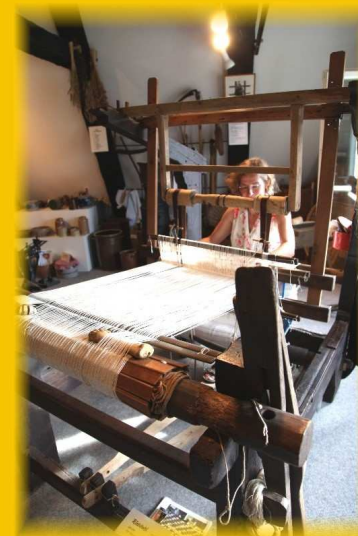
Webstuhl in Aktion