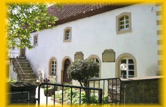
Lüstringer Straße 31 - Hof Eickhoff - 49143 Bissendorf / Natbergen

Museum für Landwirtschaft u. Handwerk der - Technischen Abteilung - Heimat - u. Wanderverein Bissendorf e.V.