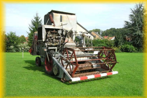
Mähdrescher von 1961