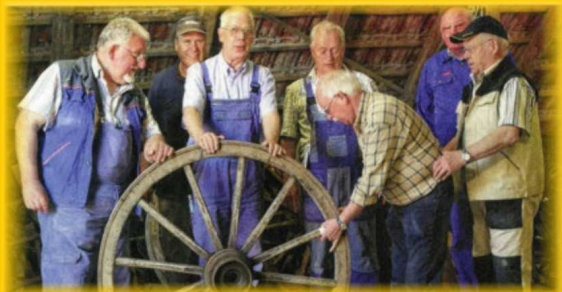
Die tatkräftige Mannschaft