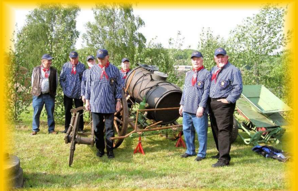
Vorbereitung einer Ausstellung